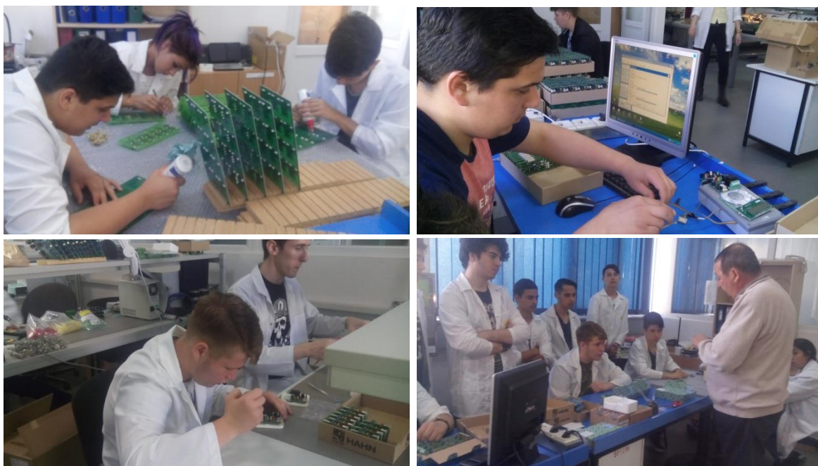
Imagini din timpul stagiilor de practică desfășurate la S.C. FELIX ELECTRONIC SERVICES SA